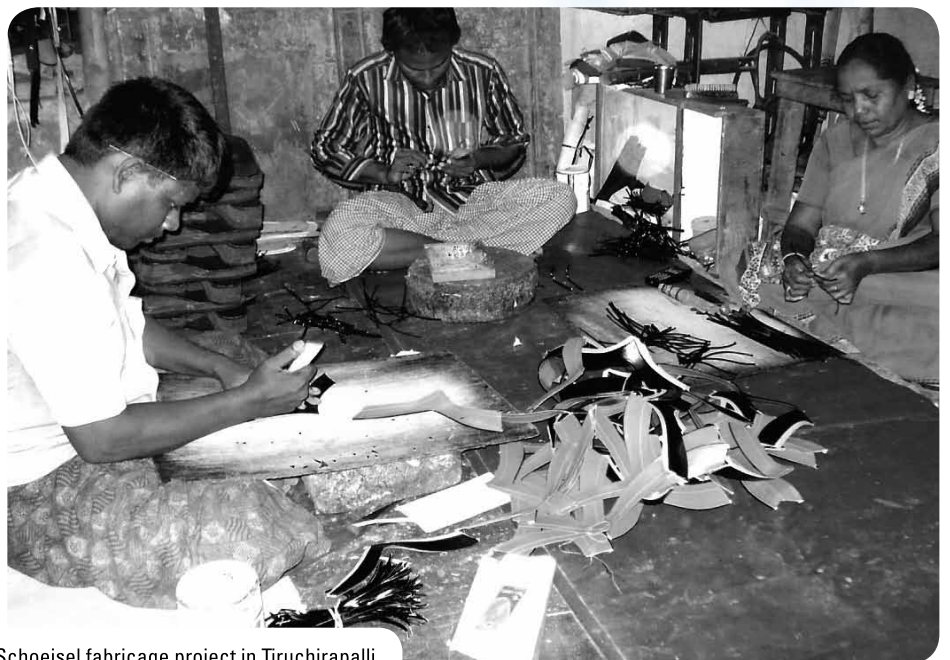
Schoeisel fabricage project in Tiruchirapalli

2. Schoenfabricage-project. Een project voor de Dalits in Tiruchirapalli zuidoost India. Dalits zijn de allerarmsten, de z.g. 'onaanraakbaren'. Vincentius doet al het nodige, zoals studie faciliteiten voor de kinderen. Maar nu dus dit werkgelegenheidsproject voor schoeisel. Er is goed onderzoek gedaan naar de haalbaarheid en vastgesteld is dat zo'n project levensvatbaar is. Met een beetje goede wil kunnen de 250 gezinnen hier straks een inkomen verdienen bij het maken en verkopen van schoeisel, via eigen fabricage en showroom. De eerste ruim € 800,- is ter plaatse al bijeen gebracht. Van ons wordt gevraagd € 3.350,-.