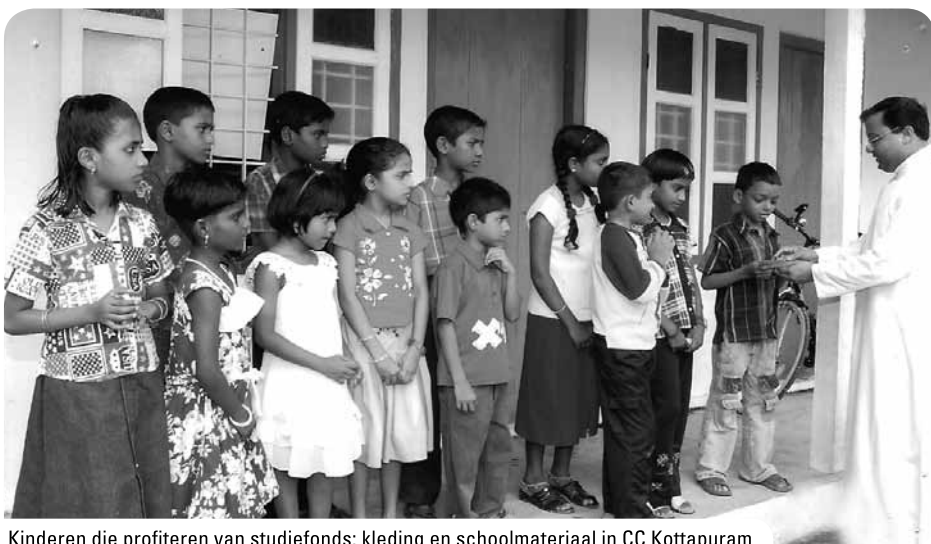
Kinderen die profiteren van studiefonds: kleding en schoolmateriaal in CC Kottapuram

Het Van Ruiten Memorial Scholership (RMS): studiebeurzen aan studenten voor hogere beroeps- en universitaire opleidingen van ongeveer 4 a 5 jaar studie; alle studierichtingen komen hiervoor in aanmerking; kosten voor 1 beurs € 80,- per jaar. Per jaar rekent de Vincentiusvereniging-India op € 10.000,- aan bijdrage van onze kant. Gemiddeld genomen betekent dit voor 240 studenten een studiejaar. In de periode juni 2008-april 2011 is voor deze projecten € 30.000,- besteed.